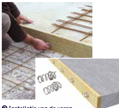
2 Installatie van de veren.