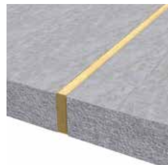
3 Afwerking van de bewerkte voeg met Plakafeu banden.

Het is aan te raden om een hoogte van band te kiezen, die minstens gelijk is aan de hoogte van de vloer. Het overschot kan gemakkelijk verwijderd worden.