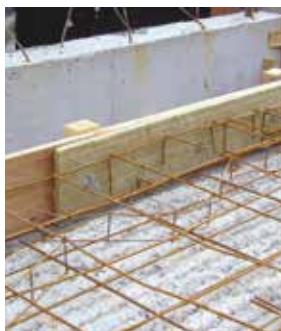
1 De banden op de vloer-randbekisting spijkeren.