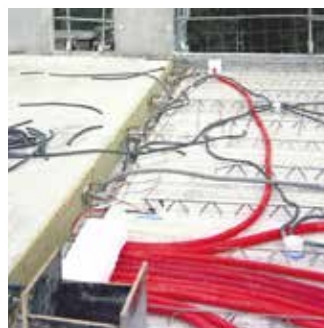
2 Betonneren van de 1e fase en Titan deuvels 2e fase. Plaatsen van de veren.