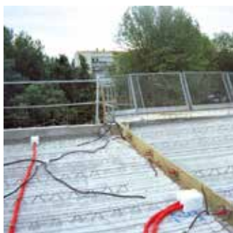
1 Plaatsing van Titan deuvels 1e fase.