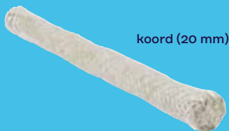
koord (20 mm)