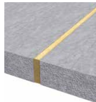
3 Afwerking van de behandelde voeg met Plakafeu banden.

Het is aan te raden om een hoogte van band te kiezen, die minstens gelijk is aan de hoogte van de vloer. Het overschot kan gemakkelijk verwijderd worden.