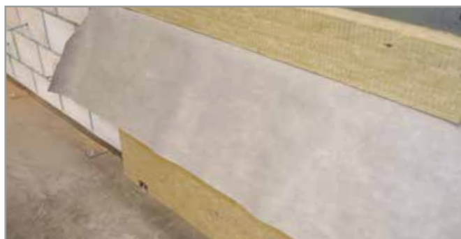
Après que les membranes soient placées, le reste de l'isolation peut être mise en place.