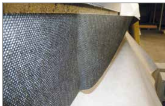
La bande Korbo dry+ est placée au dessus du Korbo Dry.