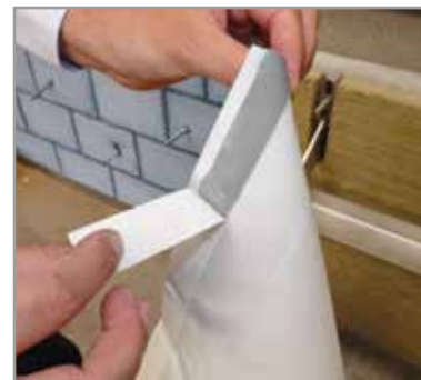
Korbo Dry est pourvu d'une bande de butyle auto-collante.