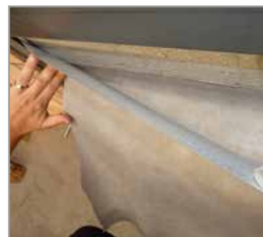
La bande Korbo Dry+ est auto-collante et facile à placer.