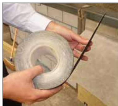
Korbo Dry+ tape verzekert de hechting op lange termijn.