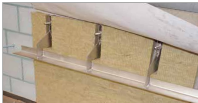
Eindresultaat van de aangebrachte Korbo Dry over de Korbo metselwerkondersteuning en isolatie.