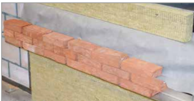
De Korbo Dry wordt in de eerste vrije horizontale voeg geplaatst. Eventueel spouwvocht zal hierlangs wegvloeien.