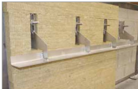
Proefopstelling van een Korbo metselwerkondersteuning