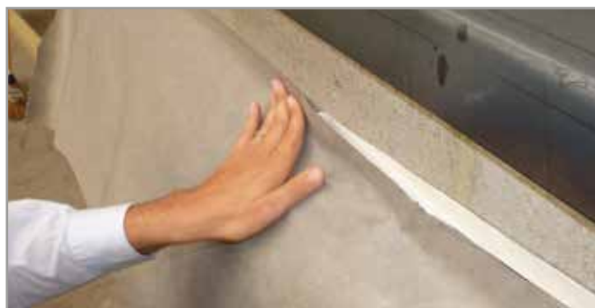
Korbo Dry is eenvoudig aan te brengen op de ondergrond.